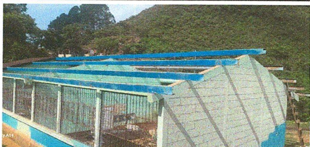
Foto1: Cambio de pintura de las costaneras